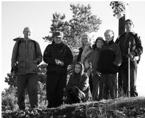
pohoda na Vyšehrade