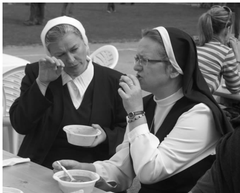
na Farfeste nám chutilo